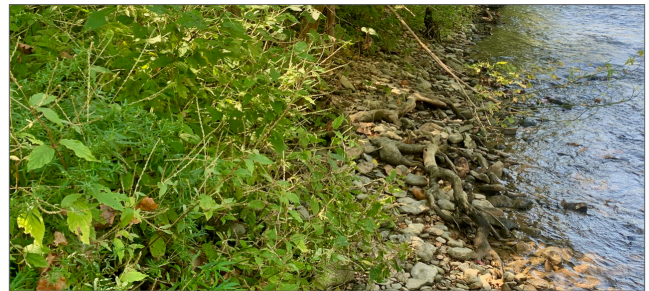
Fig. 3. La propagación inicial de la flor de paja japonesa generalmente continúa a lo largo de las orillas de los ríos, pero también puede extenderse a los hábitats de las tierras altas.