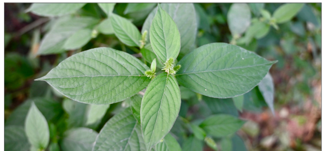
Fig. 4. La flor de paja japonesa tiene hojas opuestas con márgenes lisos y la nervadura prominente.