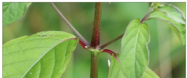
Fig. 5. Los tallos son cuadrados y con frecuencia tienen un color rojizo, especialmente en los nodos.