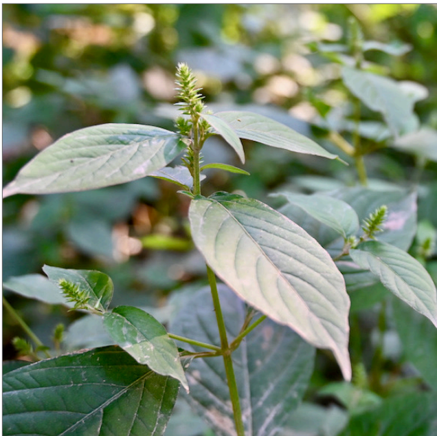
Fig. 1. La flor de paja japonesa puede formar un rodal denso, desplazando a otras especies de plantas.

Los científicos y los administradores de tierras están preocupados sobre la flor de paja japonesa a causa de la velocidad con la que se hace cargo después de llegar a un área. La planta forma los monocultivos densos en los hábitats ribereños sensibles (Fig. 1) que impactan negativamente la diversidad y la regeneración de las plantas nativas, así como el hábitat para otras especies y la calidad del agua.