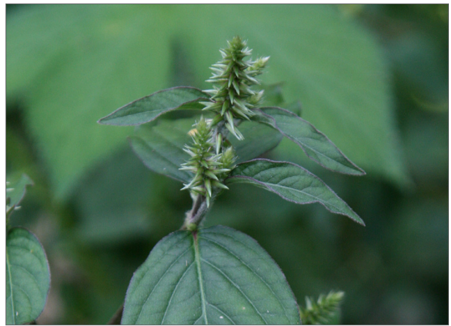
Fig. 6. Las flores son verdes y se organizan en una espiga (que parece a un limpiabotellas) que se alarga mientras se desarrollan las semillas.

Lee y sigue todas las instrucciones de la etiqueta cuando usa el herbicida. Se debe tener cuidado para evitar los impactos no deseados. Cuando aplique los herbicidas cerca del agua, usa formulaciones etiquetadas para el uso acuático. Los siguientes herbicidas han demostrado ser eficaces para controlar la flor de paja japonesa: éster 2,4-D, amina triclopir, glifosato, aminopiridina, una mezcla de triclopir y fluroxipir, y una mezcla de aminopiridina y metsulfurón.