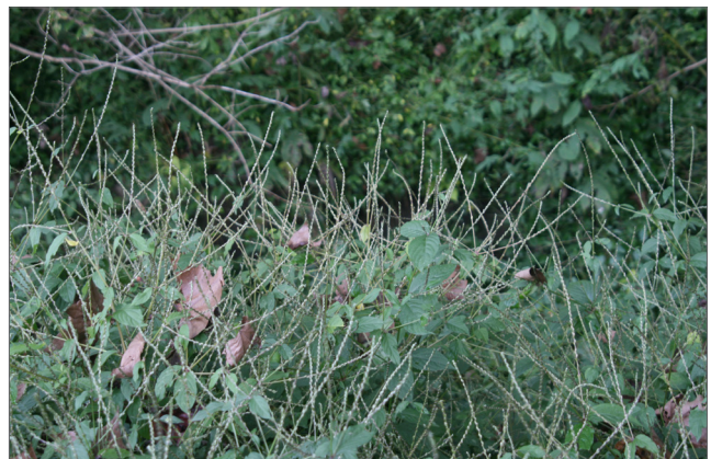
Fig. 7. Las semillas de la flor de paja japonesa se desarrollan en largas espigas de color marrón que persisten durante el invierno.