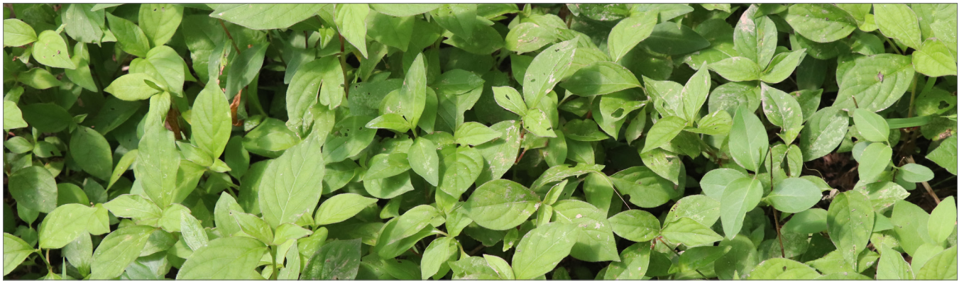
Fig. 9. Plantas inmaduras, pre-reproductivas.