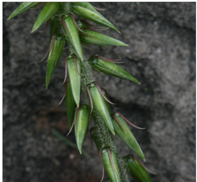
Fig. 8. Las brácteas rígidas en la base de las semillas les permiten adherirse al pelo de los animales y a la ropa, lo que facilita el transporte accidental de la flor de paja japonesa.